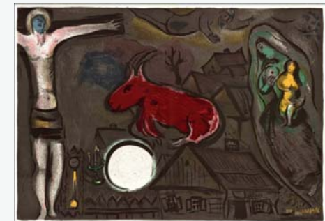
Natività, Marc Chagall, 1941