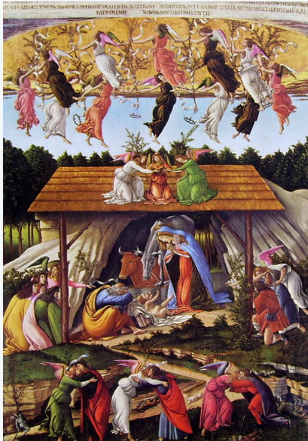
“Natività mistica”, tempera su tela di Sandro Botticelli, 1501 (Londra, National Gallery)

La Scuola Secondaria di 1° grado di Apice è lieta di invitarvi alla manifestazione natalizia