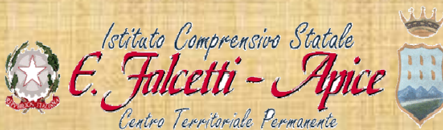
IMMAGINE DI COPERTINA: